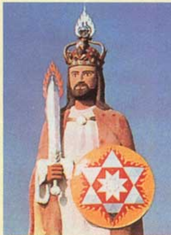
Le Christ cosmique. "Jésus kitsch" ?

"équilibrer les énergies de chaque religion pour cristalliser de nouveau l'idéal d'unité, de tolérance et d'amour divin". La cour d'appel d'Aix ainsi que la cour de Cassation ont rejeté les appels des "fous de Bourdin" qui veulent à tout prix conserver leur idole. On attend les bulldozers ! Leur site officiel : www.aumisme.org