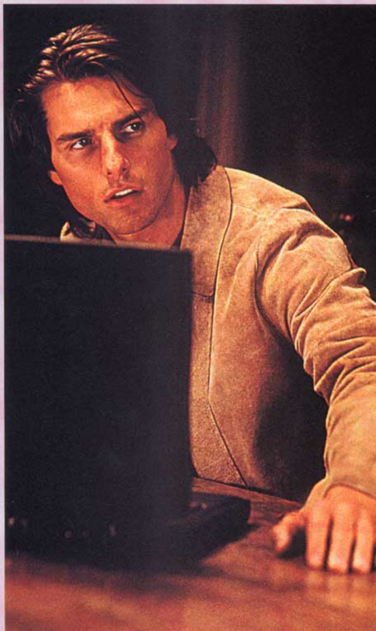
Nier ses liens avec l'Église de Scientologie ? Mission Impossible !

L'une des plus grosses ripostes à "l'église" est sûrement le site de Heldal Lund, "Operation Clambake", www.xenu.net qui dévoile, entre autres, comment atteindre les niveaux les plus hauts de l'organisation et ce, sans passer par la caisse. Tant mieux me direz-vous car le site dévoile aussi les tarifs de la thérapie hubbardienne. Ainsi, pour toucher du bout des doigts le sommet de la secte, le niveau OT 8, il vous faudrait déboursier près de 2 millions de francs. Autre révélation, les rouages du fameux e-meter de la Scientologie, un appareil destiné à mesurer l'émotion ressentie par un adepte lors d'une série de questions et ce pour déterminer l'orientation de sa "cure de Dianétique". Vendu aux Auditeurs, personnes qui font passer des tests aux adeptes, environ 30 000 francs. Le site